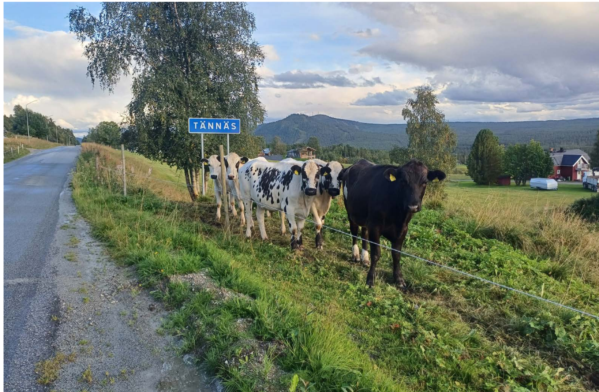
Fåbodlivet är en del av Härjedalens folkkultur, liksom högtider som Olofsmässan och mat som flötgröt. Landskapsrätten är stekt röding med flötgröt i messmörsås.

Tapper beskriver ett liv där man både från norskt och svenskt håll gick över gränsen för att arbeta på gårdarna. Han reflekterar över huruvida man i dag skulle kunna göra samma vandring men kommer fram till att de gamla stigarna sedan 100 år tillbaka är igenväxta.