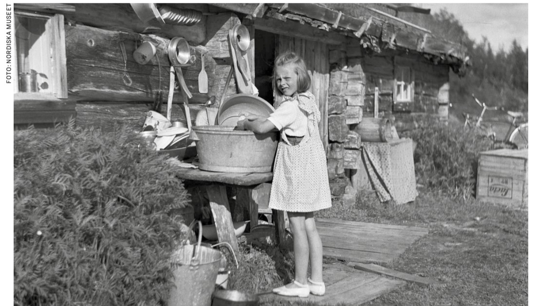
Flicka diskar mjölk på Östra Djupdalsvallens fåbod i Bruksvallarna, tidigt 50-tal.